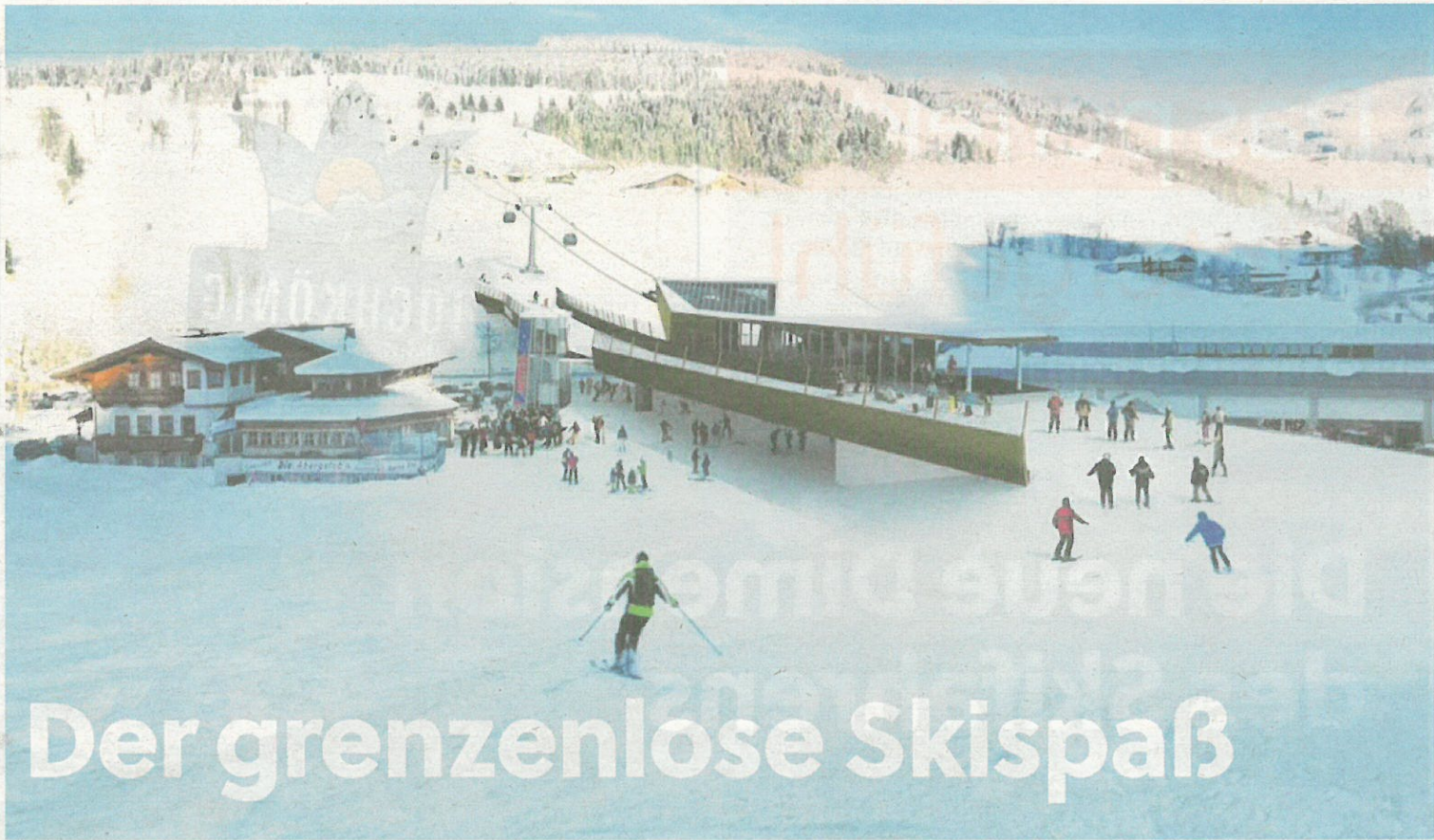
Die neue Skibrücke, die die Bundesstraße B 164 überspannt und den Natrun mit den Anlagen am Aberg verbindet.