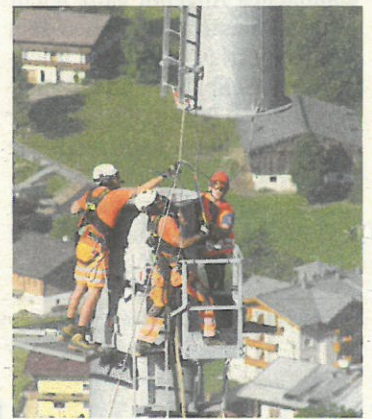
Im September 2017 starteten die aufwendigen Bauarbeiten für die zwei neuen Bahnen und die dazugehörige Infrastruktur – inklusive neuer Beschneigung.