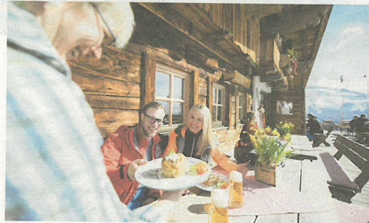
Kulinarischer Hochgenuss auf den Hütten entlang der Königstour – aber auch im gesamten Skigebiet.