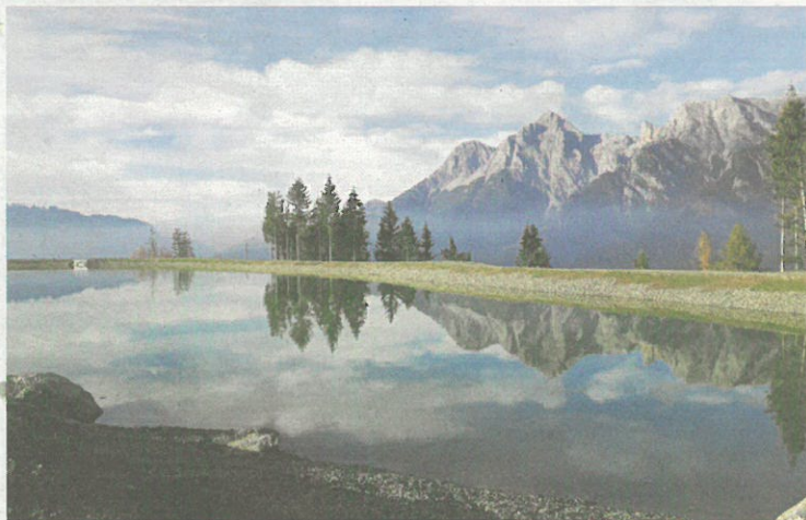
Für die neue Beschneigung am Natrun wurde ein neuer Speicherteich direkt am Gipfel errichtet.