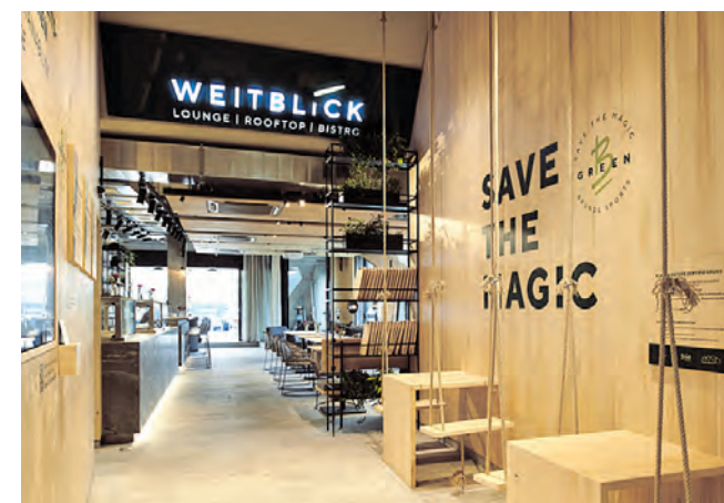
„WEITBLICK“ – Lounge | Rooftop | Bistro.