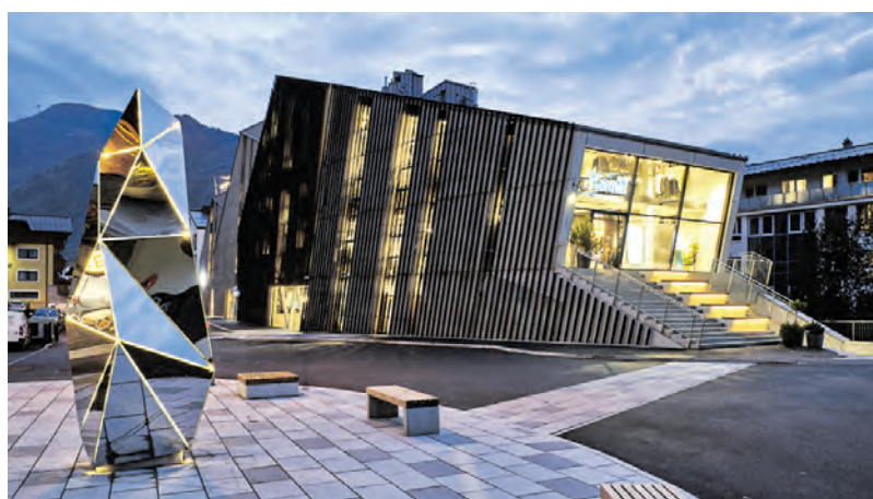
Der Bründl Skywalk. Rechts: „MOVE“ – die neue Skulptur am Bründl Sports Vorplatz.