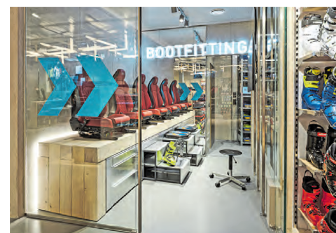
Das neue Skischuh-Fitting Labor.