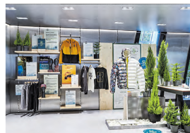
Der nachhaltige Bründl Sports Flagshipstore.

te oder Tischreservierungen findet man unter: www.weitblick-brundl.at