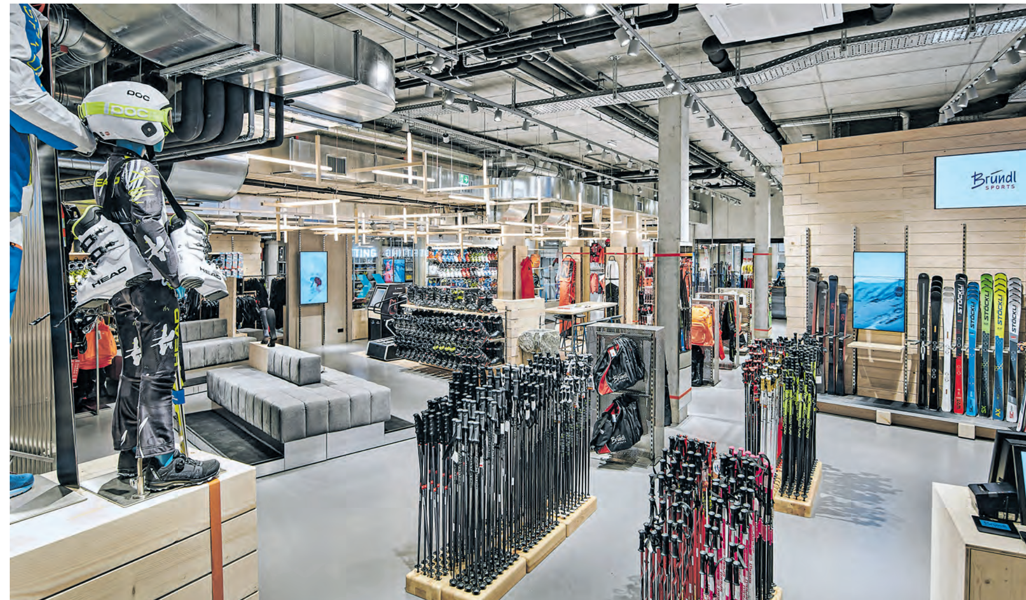
Die Ski- und Schuhabteilung hat sich bei Bründl Sports flächenmäßig verdreifacht.

Vom gesunden Frühstück mit diversen kreativ interpretierten Gebäckvariationen über energiereiche, schmackhafte Salate, Suppen, Eintöpfe bis hin zu regionalen Leckerbissen und süßen Naschereien für zwischendurch werden Gäste – immer unter Beachtung der Bründl Sports B-Green Philosophie – verwöhnt. Weitere Informationen, Öffnungszeiten, die Speisekar-