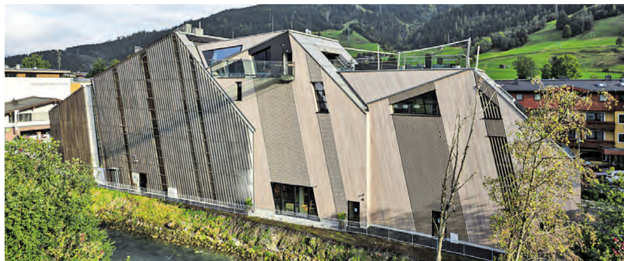
Rückansicht inkl. Glassteg des neuen Bründl Flagshipstores.