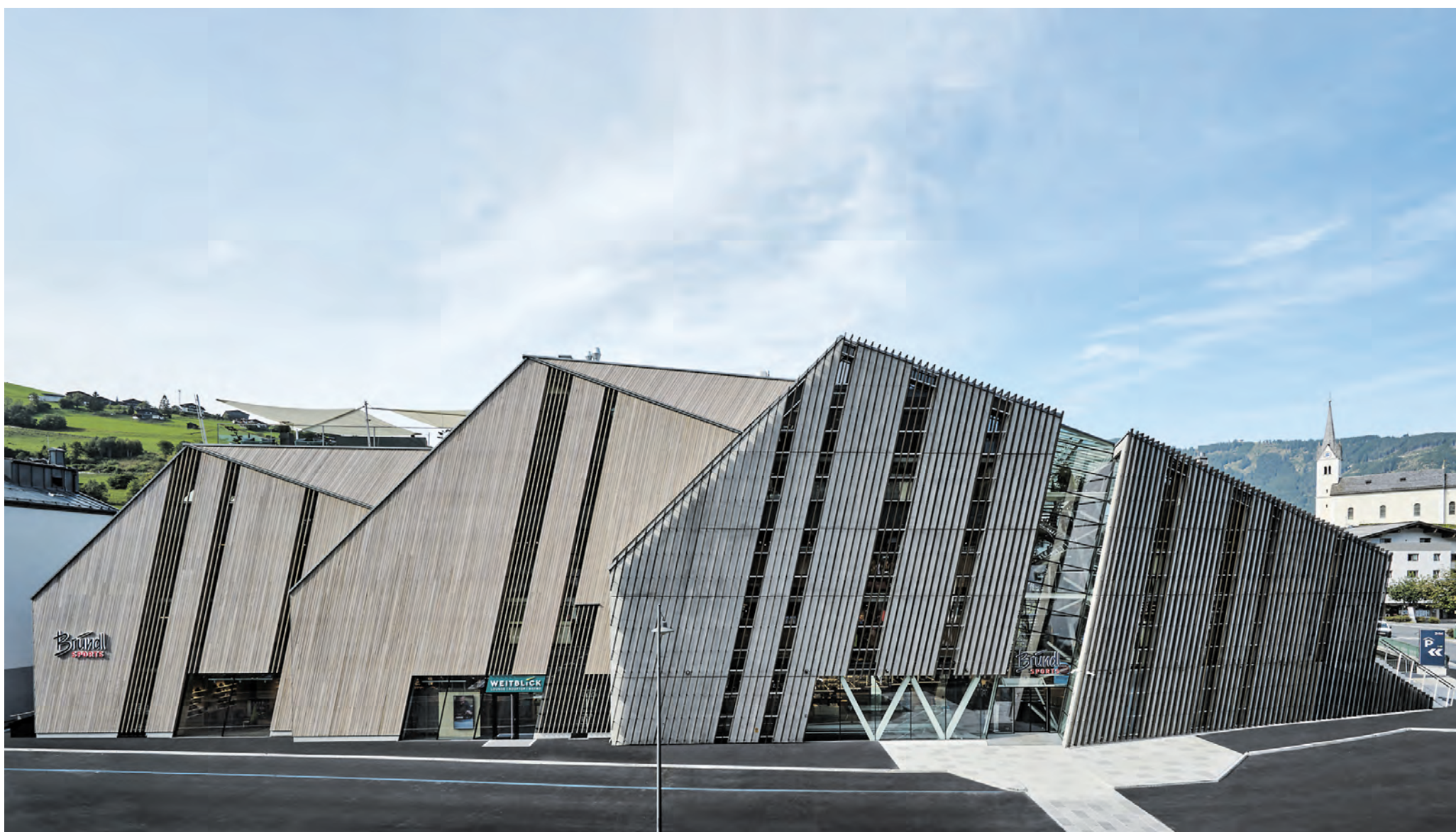
Der neue Bründl Sports Flagshipstore eröffnet am 1. Oktober 2021.