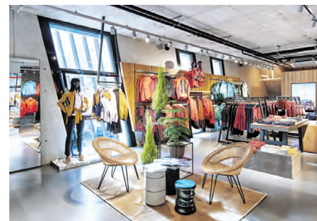
Loungebereiche steigern die Aufenthaltsqualität.